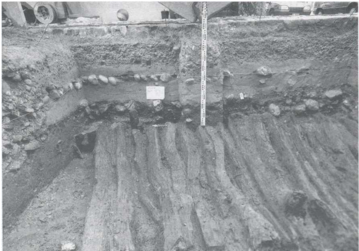
Abbildung: Der Prügelweg von 1256/57. Im Hintergrund sind deutlich die Überschwemmungsschichten auszumachen, die allmählich zum heutigen Gasseniveau führten.