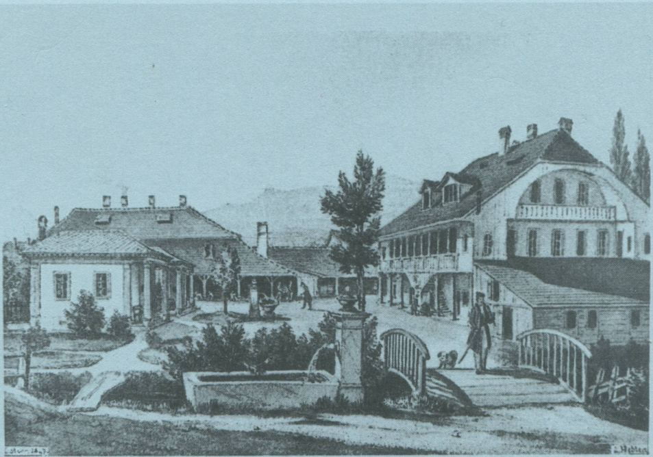
Die Rotfarb, erbaut 1817.